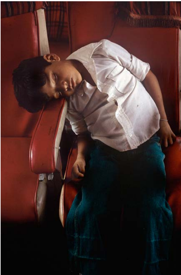
Baranquilla, Colombie, 1980

« Le vrai bonheur serait de se souvenir du présent. » Jules Renard