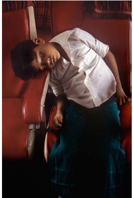
Cusarare, Sierra Tarahumara , Mexique, 2010