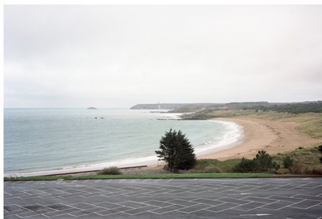
Cap Fréhel

Après les Pays-Bas et la Syrie, André Mérian poursuit son travail photographique sur les frontières urbaines en Bretagne, terre de son enfance. Sa série Ouest , vidée de toute nostalgie, étudie le territoire transformé par l'homme. Les photographies sont actuellement exposées jusqu'au 23 février à la galerie Les Douches à Paris et publiées ce mois-ci dans un livre aux éditions Filigranes .