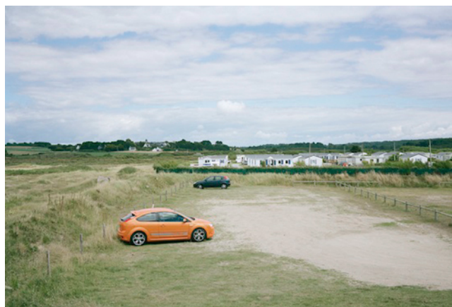
Le Pouldu © André Mérian, 2008

Bien que l'entreprise photographique d'André Mérian se focalise sur l'Ouest, elle suggère autant l'Est, le Nord que le Sud français. Il n'est pas tant question d'une région, la Bretagne, que d'une manière de voir ce territoire. Si ces observations de l'espace périurbain sont animées d'une certaine froideur, elles invitent à formuler un constat critique. Comment les développements urbains façonnent-ils nos modes de vie ? Ces choix d'aménagements sont-ils les bons ? Pour Darr Sausset, à la préface du livre publié chez Filigranes , le regard distant d'André Mérian sur son sujet – caractéristique de ses précédents travaux – dénote « une volonté de ne rien affirmer ». Conscient qu'il documente un territoire en perpétuelle mutation, André Mérian confie au spectateur le soin de construire son propre discours critique. Aberrations urbanistiques et enjeux écologiques en sont les entrées les plus évidentes.