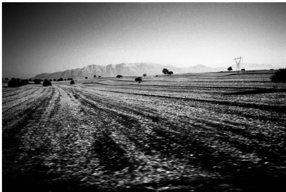
Sur la route d'Alger 2

Au fil du temps, il y a eu la possibilité d'aller en Algérie pour faire des recherches, afin de voir mes quatre demi-frères et sœurs que je souhaitais rencontrer depuis très longtemps, et découvrir les villages des ancêtres que je n'ai pas connus. Nous sommes allés à Béjaïa puis à Jijel et enfin sur le lieu de naissance de mes ancêtres, un petit village à une quarantaine de kilomètres de Jijel, au-dessus de la corniche kabyle, face à la petite chaîne montagneuse du Zouarha, paysages ressemblant, à certains égards, aux Cévennes, avec des forêts de chênes verts et de frênes dans les vallées, et, aux abords des sommets, un sol plus aride, ocre et schisteux. Sur la route, quelques bergers et leurs troupeaux de moutons ou de chèvres, des chiens errants, sur les cols, des prairies et des vaches paisibles. A l'entrée de certains villages subsistent encore des barrages de militaires ou de gendarmes, traces encore tangibles d'une guerre civile qui a ravagé le pays dans les années 90, zones montagneuses, lieux de haute résistance durant la guerre d'Indépendance avec ses monuments aux martyrs en pleine campagne, planques présumées de criminels aujourd'hui.