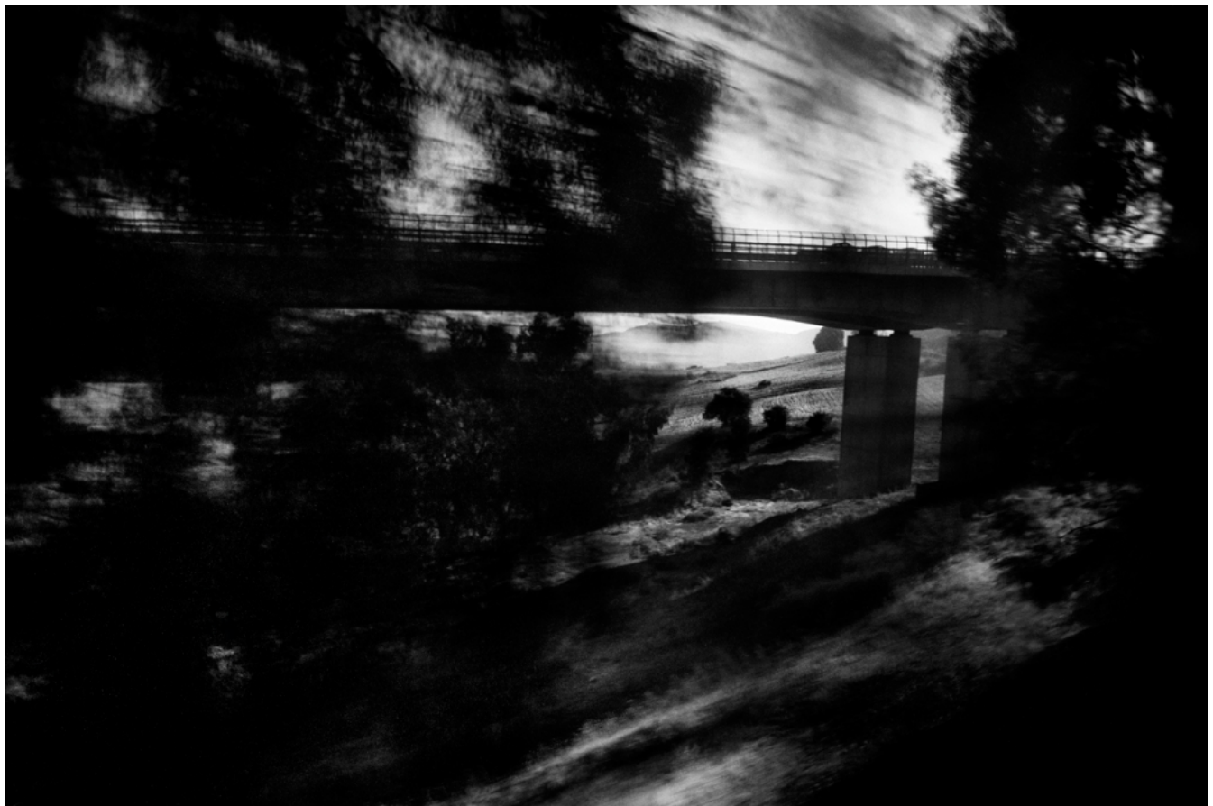
Sur la route d'Alger 1

La découverte d'Antonin Artaud fut déterminante en effet, qu'il s'agisse de L'ombilic des limbes , Van Gogh ou le suicide de la société ou de Pour en finir avec le jugement de Dieu , dont j'ai utilisé un extrait de l'enregistrement sonore pour un diaporama sur l'architecture en Europe et le mur de Berlin en 1988. Je n'ai jamais lu Jean Genet. En revanche, les lectures de Maurice Blanchot, Georges Bataille, Matière et mémoire d'Henri Bergson, les essais sur l'imagination de la matière de Gaston Bachelard, les poèmes d'Henri Michaux, d'Attila József, ont accompagné mes recherches depuis longtemps. Plus tard, Nedjma , le chef d'œuvre de Kateb Yacine a ouvert de nouvelles voies, entre roman, poésie, histoire et engagement politique.