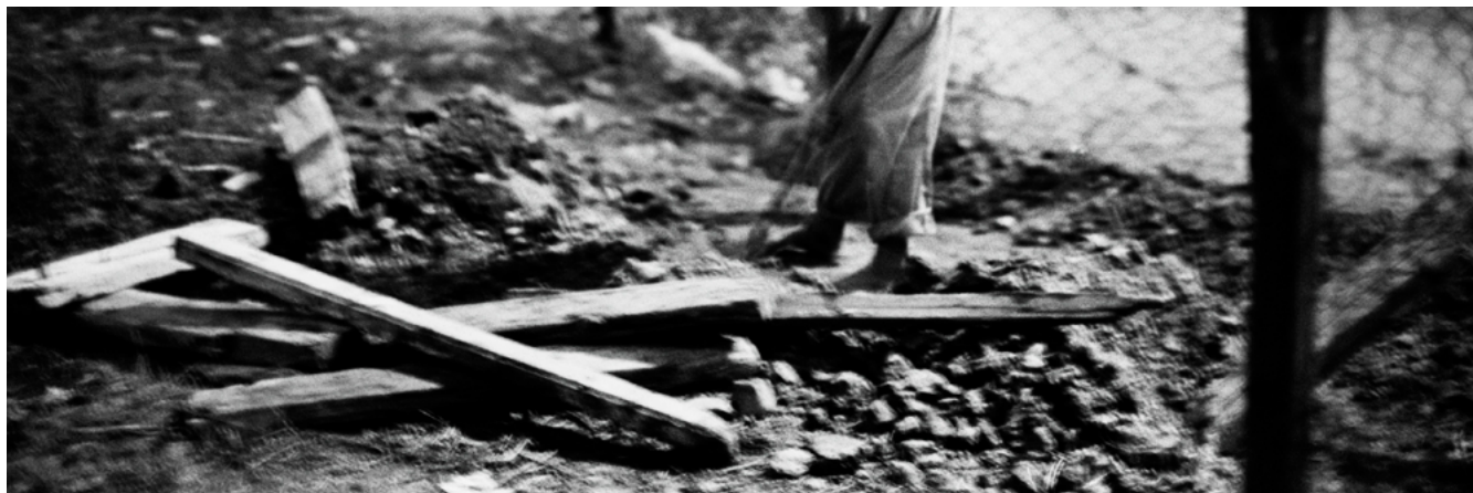
Banlieue d'Alger, 2013

Au fil du temps, il y a eu la possibilité d'aller en Algérie pour faire des recherches, afin de voir mes quatre demi-frères et sœurs que je souhaitais rencontrer depuis très longtemps, et découvrir les villages des ancêtres que je n'ai pas connus. Nous sommes allés à Béjaïa puis à Jijel et enfin sur le lieu de naissance de mes ancêtres, un petit village à une quarantaine de kilomètres de Jijel, au-dessus de la corniche kabyle, face à la petite chaîne montagneuse du Zouarha, paysages ressemblant, à certains égards, aux Cévennes, avec des forêts de chênes verts et de frênes dans les vallées, et, aux abords des sommets, un sol plus aride, ocre et schisteux. Sur la route, quelques bergers et leurs troupeaux de moutons ou de chèvres, des chiens errants, sur les cols, des prairies et des vaches paisibles. A l'entrée de certains villages subsistent encore des barrages de militaires ou de gendarmes, traces encore tangibles d'une guerre civile qui a ravagé le pays dans les années 90, zones montagneuses, lieux de haute résistance durant la guerre d'Indépendance avec ses monuments aux martyrs en pleine campagne, planques présumées de criminels aujourd'hui.