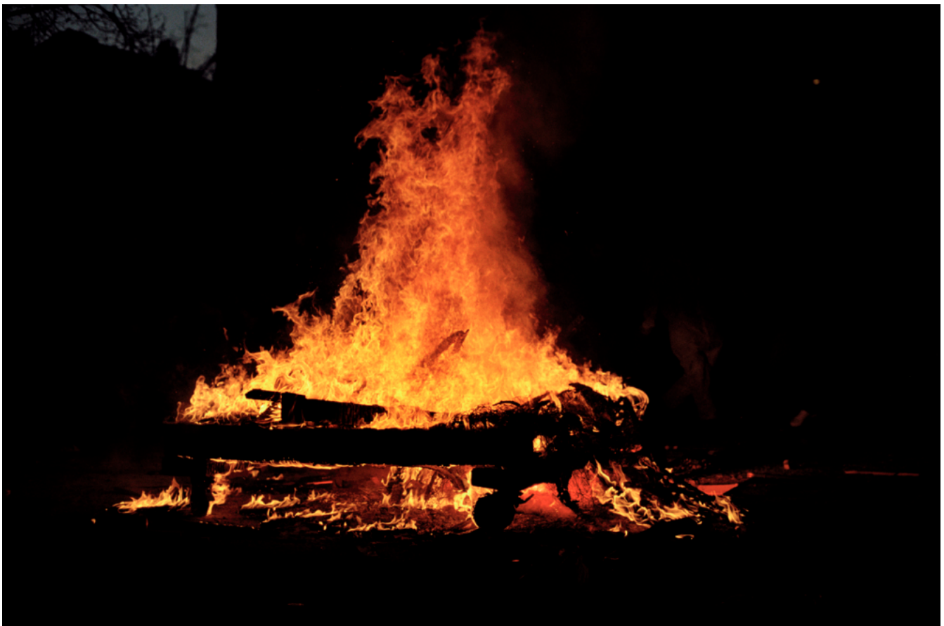
Fête de printemps, 2008

On manque toujours de temps... il faut faire avec ou sans, l'essentiel étant d'être en pleine santé et de garder l'envie de créer, de découvrir, de partager.