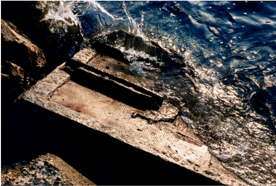
Ressac, Marseille, 2001