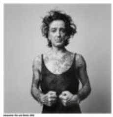
Retrato de su hijo, 2018

Alberto García-Alix, uno de los grandes fotógrafos españoles de la actualidad, nos muestra en esta obra una selección de sus fotografías más recientes, en un momento de su vida en el que se ha convertido en un artista más allá de la fotografía. Su obra se centra en el cuerpo humano, en la identidad y en la memoria. A través de sus imágenes, García-Alix explora la relación entre el cuerpo y el alma, entre lo físico y lo espiritual. Su estilo es característico por su uso de la luz y el color, creando una atmósfera íntima y evocadora. En esta obra, el autor nos muestra una serie de fotografías que reflejan su evolución como artista y como persona. Desde retratos de familiares hasta imágenes más abstractas, García-Alix nos invita a reflexionar sobre la naturaleza humana y la búsqueda de la identidad. Su obra es una exploración constante de los límites de la fotografía y de la capacidad del arte para capturar la esencia de lo que vemos.