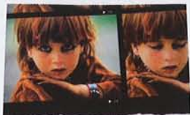
Derrière l'objectif de Reza