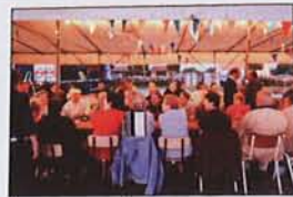
Portrait d'un village français