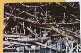
Entre le cœur et l'écorce

► Images et musique Patrick Batard a livré une série de photos pour la pochette de l'album de Michel François. Certaines de ces images ont été mises en chansons par Michel François. Un échange qui est à l'origine de ce livre. CM "Entre le cœur et l'écorce", textes et photos de Michel François et Patrick Batard, auto-édité (www.lavisiondupersicope.com), avec 1 CD 2 titres, 24 €.