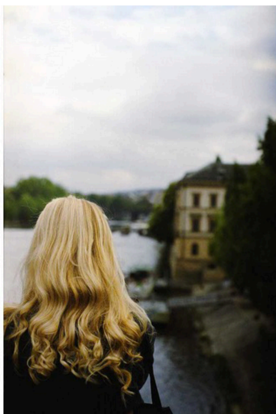
© Nicolas Comment - Pont Charles, Prague, 2006

📅 Expositions du 18/03/2017 au 06/05/2017