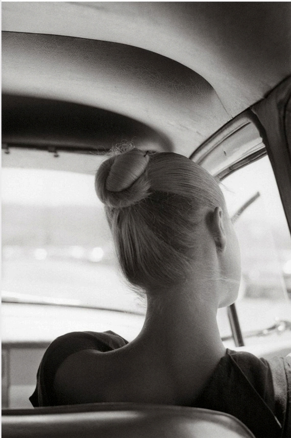
Los Angeles, 1974.

Dans la postface de Glamour , publié présentement par les éditions Filigranes, Païni explique que des problèmes de droit sur la réutilisation des images de la collection ont empêché le republication de sa première version. La solution ? Demander à son ami Plossu de l'aider à illustrer sa vision du glamour. Ainsi, Païni choisit 36 images dans la première sélection que le photographe a lui-même extraite de son fonds. Voici comment est né le livre.