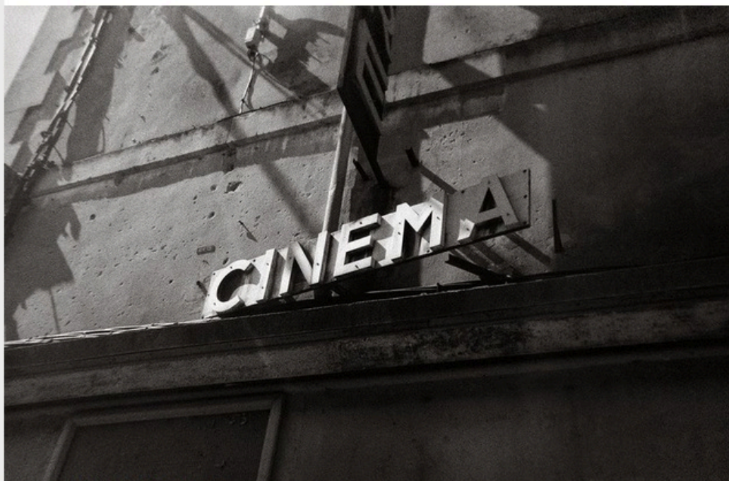
La Ciotat, 2003.

Oui, toi, lecteur, mon semblable, mon frère, tu t'es déjà perdu dans la douceur et l'élégance des images de Bernard Plossu . Tu t'es déjà surpris à essayer de lire les enseignes d'une rue italienne d'un tirage Fresson , et à te souvenir de la plage d'Argent de Porquerolles en regardant la blancheur des blancs de Plossu... Alors oui, tu te dis qu'évidemment, le titre Glamour ne peut que parfaitement épouser les images de cet homme qu'on pressent doux.