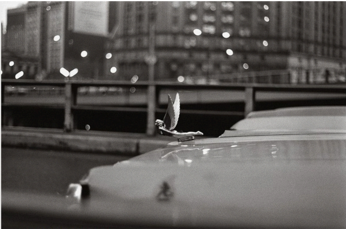
New York, 1973.

Oui, assurément les images de l'homme de La Ciotat sont glamour. Oui, elles restent imprécises dans le temps, la géographie, dans leur rendu même. Oui, elles invitent plutôt qu'elles n'insistent, suggèrent plutôt qu'elles ne montrent, soufflent plutôt qu'elles ne chuchotent. En cela, elles sont glamour. Plossu montre, le passant regarde, et voit quelquefois. Cette distance qu'elles imposent révoque toute forme d'intelligence rationnelle au profit de l'émotion, de l'évocation. Elles en deviennent l'incarnation. Le texte, quant à lui, tente exactement l'inverse, et c'est là sa pauvreté. Il intellectualise, jette des explications, met en perspective, s'interroge, théorise... En fait, sa justification est au nadir de ce qu'est le glamour de Plossu. Païni a tenté la gageure de définir ce qui, par essence, ne peut se circonscrire — ce que précisément réussissent parfaitement les images de Plossu. Sans mot dire.