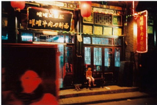
L'enfant dans la nuit, Pingyao, Chine, 2005

26 AVRIL 2017 - FRANCE , ECRIT PAR L'ŒIL DE LA PHOTOGRAPHIE