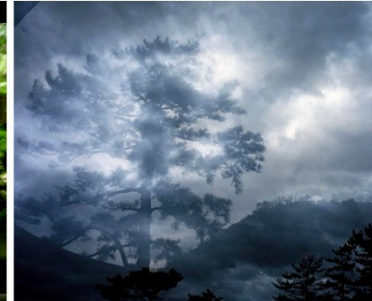
Japon, Naoshima, avril 2008