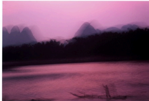
La barque rose, Yangshuo, Chine, 2005