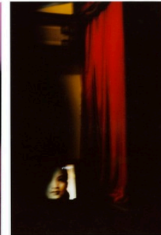
La chambre du Lu Song Yuan Hotel, Beijing, 2005