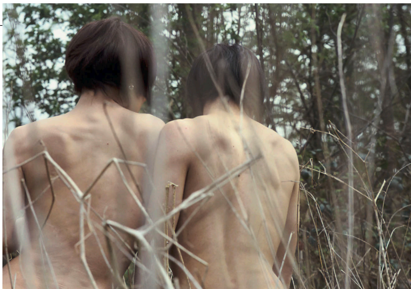
LES CHANGÈRES, JAPONAIS AU BOS DE VINCENTES © LAURE VASCONI

C e livre se prend en main comme un journal intime. Des images qui seraient partagées, jour après jour, sans ordre ni but précis. Nul texte pour contextualiser. Une note d'intention a été glissée dans l'ouvrage, avec les légendes de toutes les images, qui se résument pour beaucoup au lieu de prise de vue, et volontairement non datées. Avec les mots de son auteure, on comprend ainsi qu'on embarque pour un voyage intérieur, où se mêlent réalité et fiction. Tel un essai photographique, ce livre se concentre sur l'essentiel : un flux d'images d'archives sans chronologie. Un laboratoire qui croise ses recherches artistiques personnelles ou professionnelles, des travaux de commandes ou des